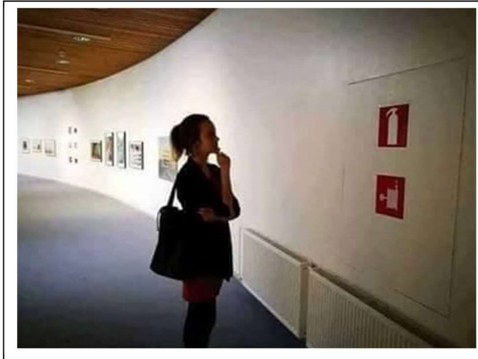
Πυροσβεστική φωλιά Δεν πουλιέται σε γκαλερί, αλλά σε πυροσβεστικά είδη

Μας λανσάρονται λες και κανείς μας δεν έχει ούτε την αίσθηση του όμορφου ούτε την σκέψη για να δει και να καταλάβει τι βλέπει ή τι διαβάζει, αλλά περιμένει τους άλλους να του πούνε.